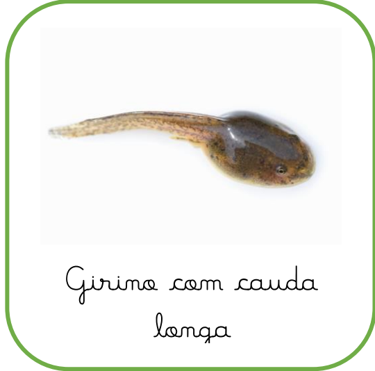
Girino com cauda longa