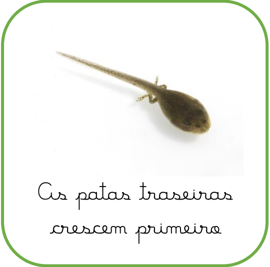
As patas traseiras crescem primeiro