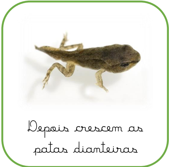
Depois crescem as patas dianteiras